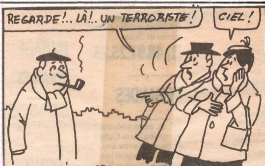
AVEC LE DÉVELOPPEMENT DE L'INTOLÉRANCE ANTI-FUMEURS, UN JOUR VIENDRA OÙ L'ON MONTRERA CEUX-CI DU DOIGT, DANS LA RUE...

DEPUIS QUELQUES JOURS, DANS TOUTE LA PRESSE QUOTIDIENNE, VOUS POUVEZ VOIR CETTE B-D DE JACQUES FAIZANT (DONT NOUS PUBLIONS UN EXTRAIT) AVEC, EN LEGENDE CECI: "CETTE PAGE DE SACQUES FAIZANT EST PRESENTE AUX LECTEURS DE LA PRESSE QUOTIDIENNE AVEC LE CONCOURS DE L'ENSEMBLE DES PROFESSIONS DU TABAC, POUR LES 15 MILLIONS DE FRANÇAIS QUI AIMENT FUMER" (DONT JE NE SUIS PAS) MAIS IL FAUT BIEN RECONNAITRE QUE L'IDEE EST TRÈS ORIGINALE ET CELA CHANGE UN PEU DES LONGS DISCOURS HYPOCRITES DES MINISTÈRES, SUR LE TABAC, QUI S'EN METTENT PLEIN LES POCHEs.